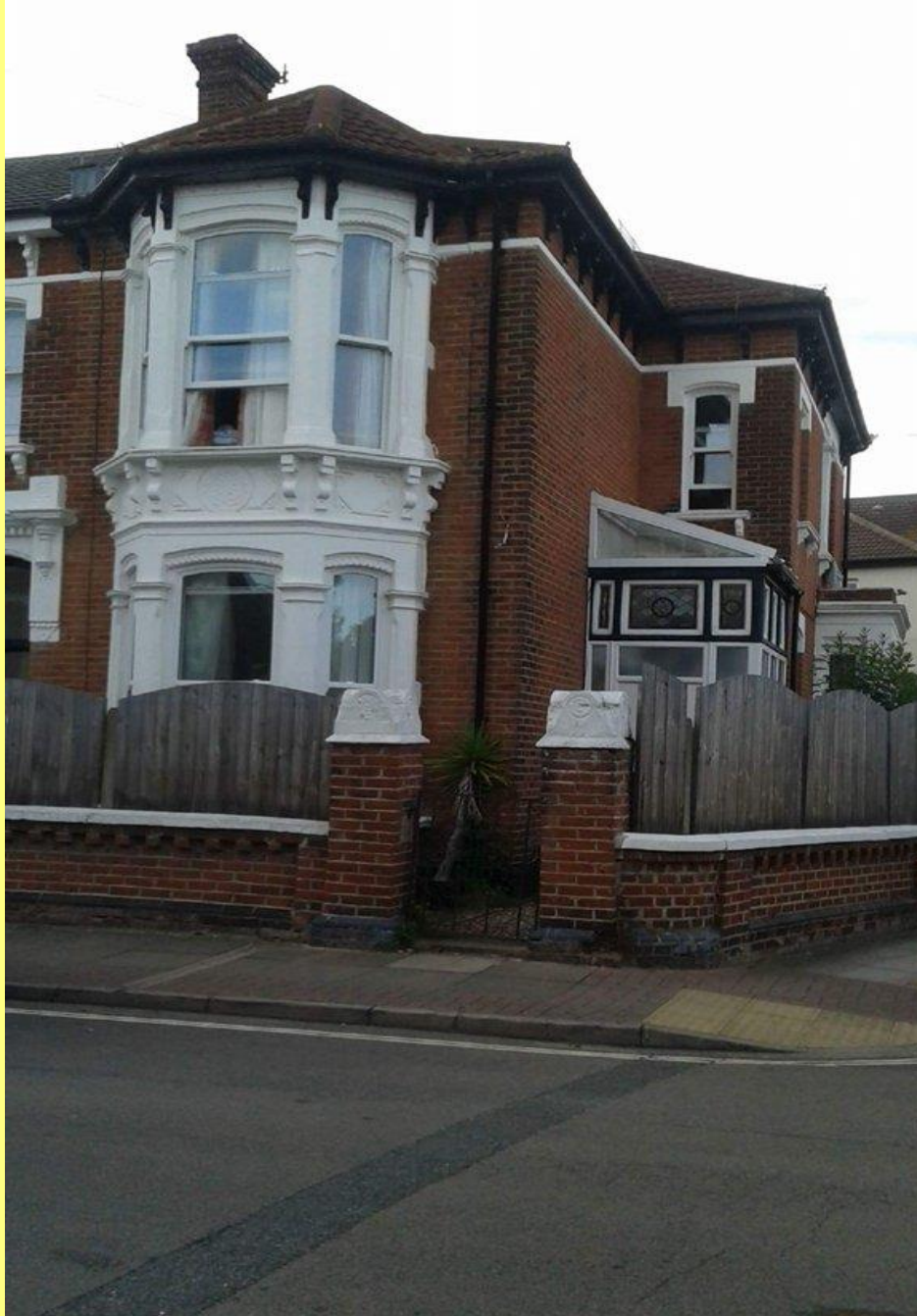
Tipikus angol házakban éltünk